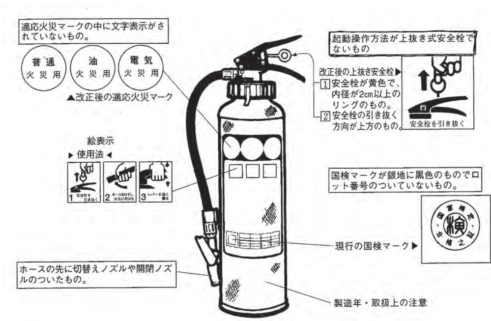
図3 形式承認が失効した消火器の見分け方