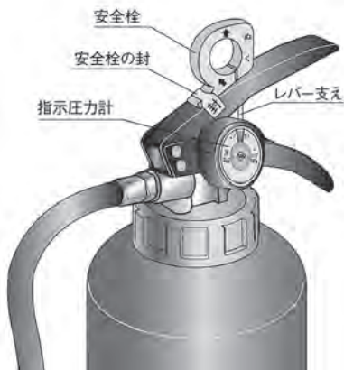
図2 一般的な消火器

らガスが放出され、その圧力で消火剤を噴出する仕組みです。この「加圧式」では、錆びた消火器を操作したために、炭酸ガスの放出によって消火器本体が破裂して死亡事故が発生したこともあり、法令で使用期限を定め廃棄・交換するように