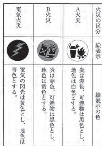
図1 火災の区分と絵表示

火災の種類が消防法で分類されています。A火災は「普通火災」、B火災は「油火災」、C火災は「電気火災」と呼ばれています(図1)。これらのどれにも使用できるということで「ABC消火器」と呼ばれています。容器内に「リン酸アンモ